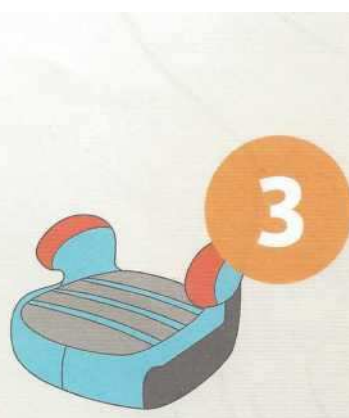
22-36 кг от 6 до 12 лет