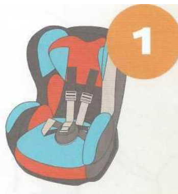
9-18 кг от 9 месяцев до 4 лет